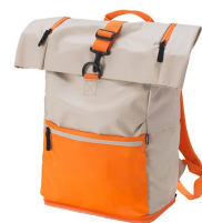
索玛 2018 背包